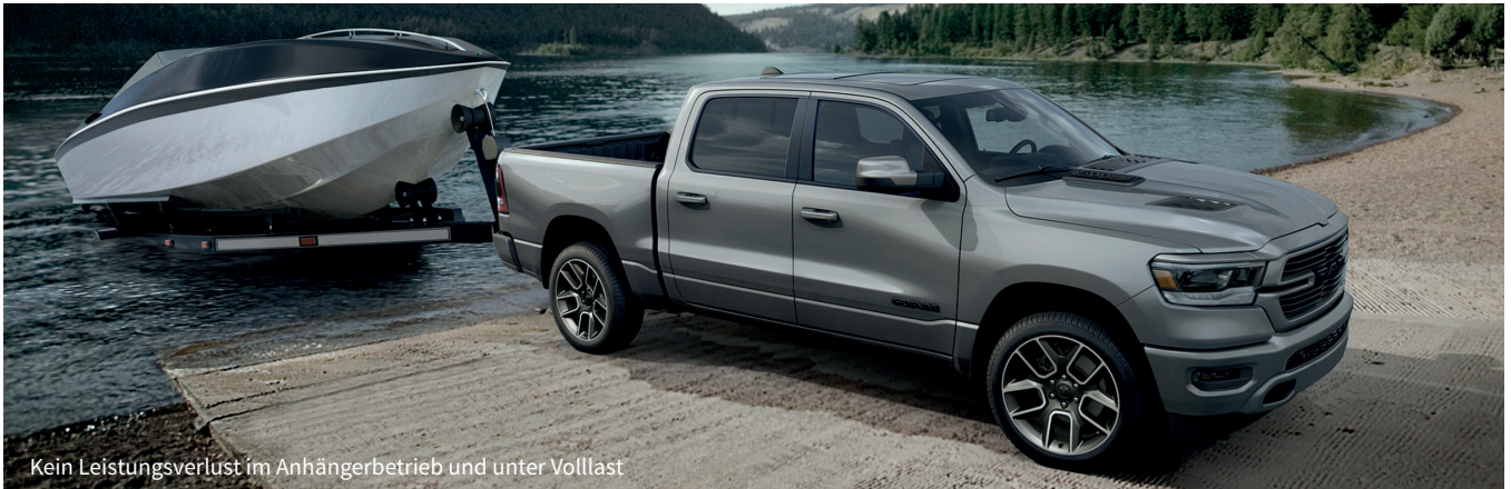
Kein Leistungsverlust im Anhängerbetrieb und unter Volllast