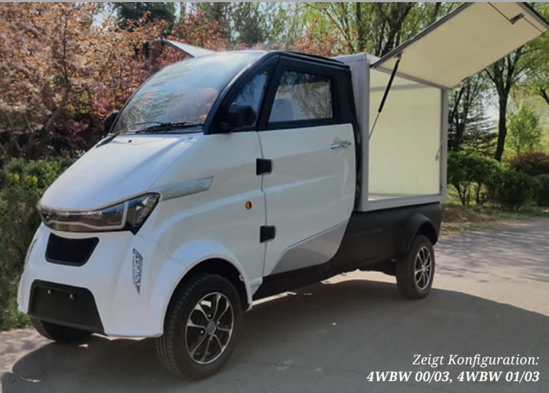
Zeigt Konfiguration: 4WBW 00/03, 4WBW 01/03