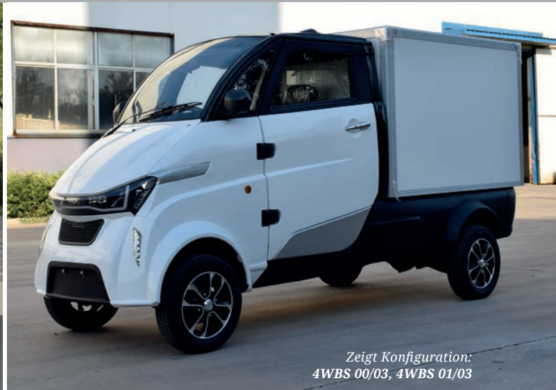
Zeigt Konfiguration: 4WBS 00/03, 4WBS 01/03

Unser CombiFuel-EV eCarrier L ist das ultimative Kurzstreckentransportfahrzeug! Die Transportlösung für die letzten Kilometer in der Stadt & Agglomeration. Für Lebensmittellieferungen, Facility Management, Restaurants, den öffentlichen Sektor, usw.